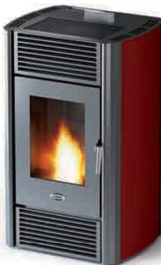
EcoNice en acero