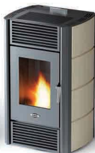
EcoNice en cerámica